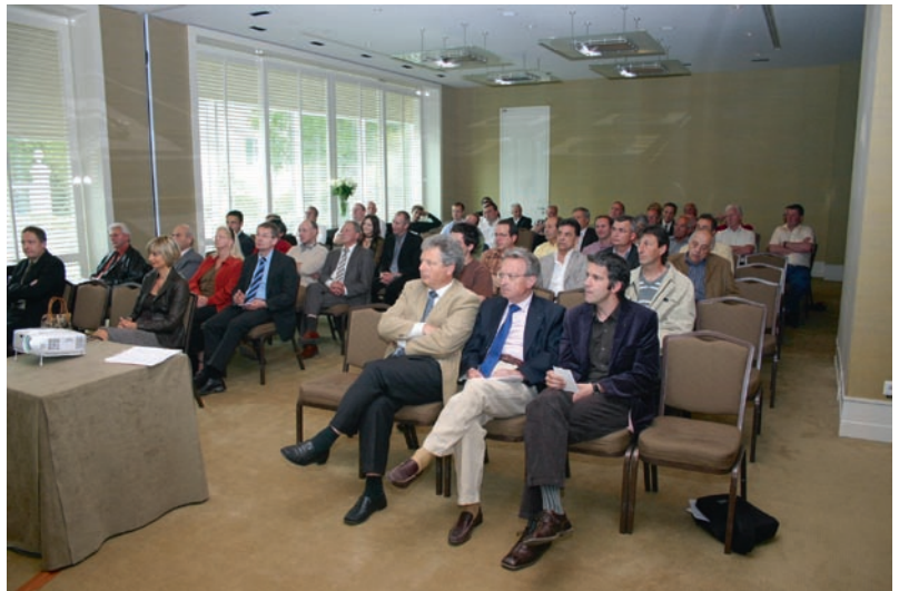
Une assemblée attentive

L'économie suisse a vécu une fin d'année extrêmement difficile. Tout allait plutôt bien jusqu'en automne où la crise financière a terrassé le monde occidental. Les entreprises suisses avaient créé tout au long de l'année 2008, plus de 63 000 nouvelles places de travail, et Genève en avait quant à elle créé plus de 4 000.